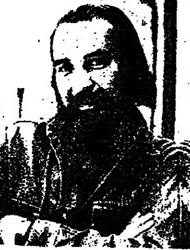
ظاهر بن جلون ومجموعته الجيدة